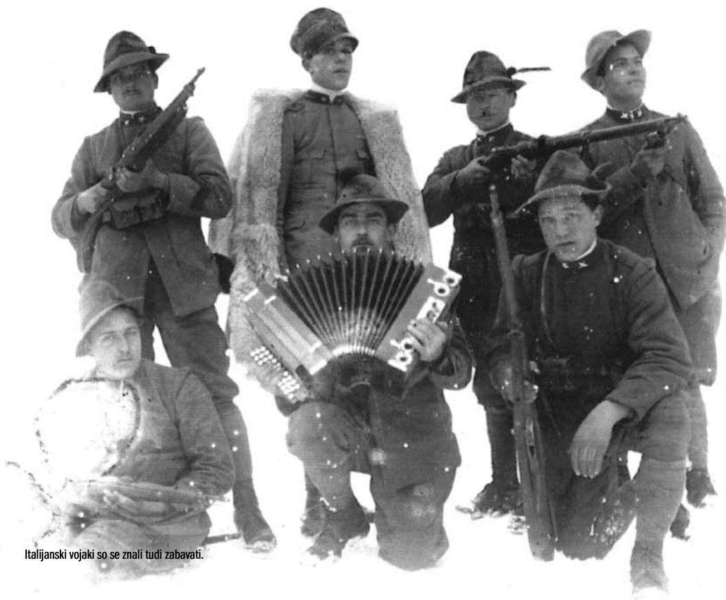
Italijanski vojaki so se znali tudi zabavati.

Pot pelje navzdol po asfaltni cesti do travnika na desni. Kadar ni trave, krenete ob desnem robu navzgor v gozd in sledite stezi. Kadar je trava in ta pot ni primerna, podaljšate hojo po glavni cesti proti kmetiji »Na Lanišah« in pod gozdom zavijete na kolovozno pot, potem pa malo naprej po grebenu, po planinski stezi navzgor do kaverne . Stavbo so zgradili v letih 1937/38. V njej so italijanski vojaki bivali do kapitulacije Italije leta 1943. Starejši domačini vedo povedati, da se jim je tako mudilo, da so v prostorih pustili posteljnino, peči in druge stvari, ki so jih nato odnesli domačini. Nekaj sto metrov zadaj levo za hribom stoji še ena, delno zrušena italijanska kaverna, ki je vidna z vrha hriba, imenovanega Šance. Obnovljen mejnik s številko 35 stoji pod Šancami, »Pr' Vrhovc« v Podlanišču.