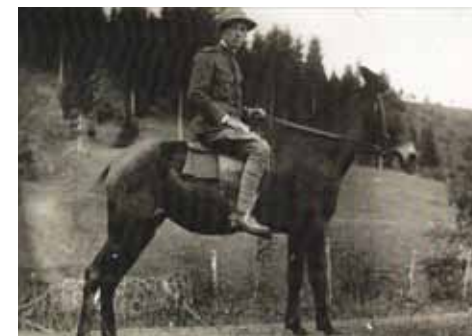
Italijanski vojak ob žici »V Lanišah«.

Tu se meja lomi in naredi ovinek do travniške doline oz. katastrske meje dveh lastnikov. Stari gospodar »Pagon« je uspel s prošnjo, da mu v Rapallu začrtana meja ni odvzela vodnega vira za napajanje živine. Sicer bi meja tekla med hišo in hlevom. Travniška pot nas vodi mimo »Pagonove« domačije do glavne ceste. V smeri Nove Oselice za cesto opazimo obnovljen vmesni mejnik 36/I, spodaj v dolini pa še druge. Višje v gozdu še stoji delno ohranjen glavni mejnik 36 .