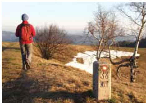
Od mejnika do mejnika.

Odpravite se mimo združnega doma, levo, ob potoku Javorščica. Čez približno pol kilometra greste mimo hiše, v kateri je v času rapalske meje cvetela kontrabantska trgovina »Pr' Malk u Grap« . Poleg hrane je bilo v trgovini moč kupiti tudi blago, čevlje Bata in export tobak. Trgovina je obratovala do leta 1942. Streljaj naprej je na levi strani potoka Jurncova jama, ki je bila v času 2. svetovne vojne oziroma obstreljevanja z italijanske strani za domačine pripravno zatočišče. Po približno 500 metrih bodite pozorni na ostanek vmesnega mejnega kamna. Meja se je od domačije »U Kacjanovš« spustila v dolino in nekaj časa naprej po Javor-