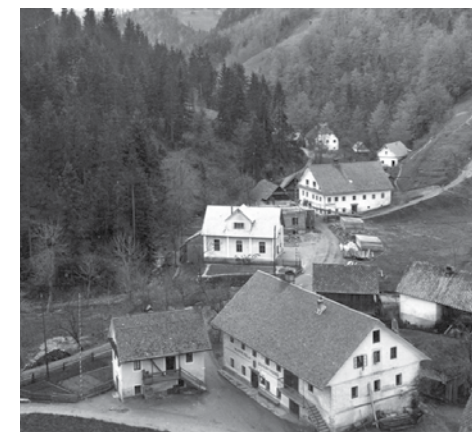
Središče Sovodnja nekoč.

Na Sovodnju se lahko odločite za pohod do mejnika št. 38, ki stoji na vrhu Javorjevega Dola (oz. Mrzlega vrha), od koder nato svojo