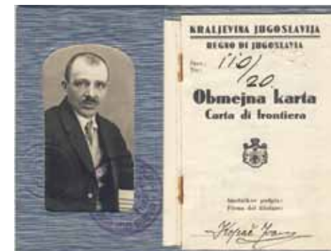
Dokument, prepustnica za gibanje ob meji in preko nje.

Življenje ob meji je ponujalo tudi številne priložnosti za dodaten zaslužek, za katerega je bilo treba imeti dosti poguma in zvitosti. Zaživel je kontrabant (tihotapstvo).