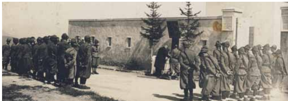
Kasarna prostovoljne policije državne varnosti MVSNI (Milizia Volontaria per la Sicurezza Nazionale) na Mrzlem vrhu (na Loncmanovi Sivki, 987 m).

Pohod začnete s prečkanjem potoka, desno čez jaso (v smeri Cerknega), kjer vas pod gozdom