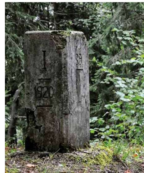
Glavni mejnik - cippo principale 39 pod vasjo Breznica.

Meja je vplivala tudi na versko življenje in šolanje otrok. Prebivalci nekaterih vasi ob meji so bili tako nasilno ločeni od svoje fare in pokopališč, saj so morali hoditi k maši na italijansko stran in tam pokopavati tudi svoje mrtve. Otroci so morali hoditi v italijanske šole, v katerih je veljala prepoved uporabe slovenskega jezika. Prebivalci so za prehod meje rabili prepustnice.