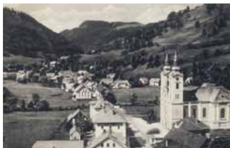
Žiri ob državni meji.

Kraj pa že od nekdaj zaznamujejo različne meje. Po grebenih na zahodnem robu žirovske kotline poteka razvodnica med Črnim in Jadranskim morjem. V rimskih časih je tod potekala meja med provincama Italijo in Panonijo ter obrambni sistem utrdb Claustra Alpium Iuliarum . V srednjem veku je tod tekla meja med gospostvom freisinskih škofov ter tolminskim in idrijskim gospostvom.