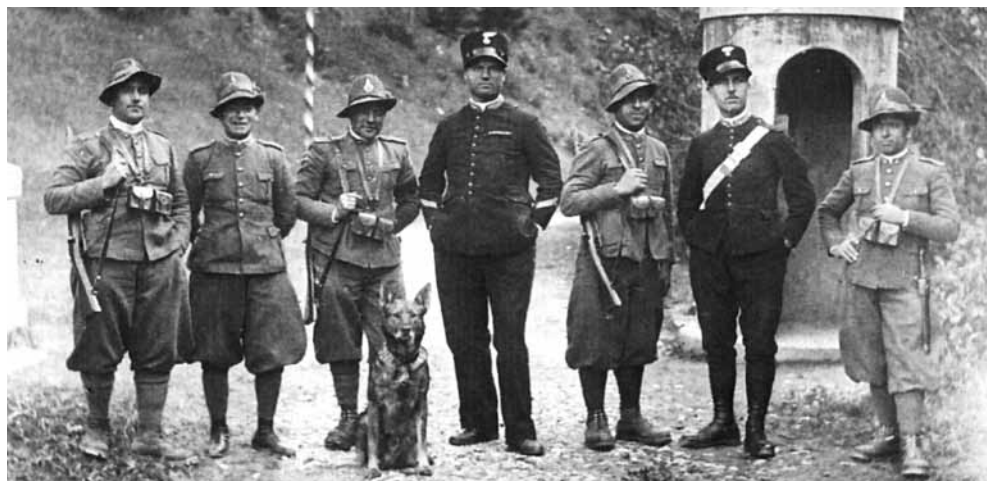
Italijanski finančni stražniki in orožniki, »karabinjerji« na rapalski meji na Cerkljanskem med obema svetovnima vojnoma.

Rapalska pogodba , ki so jo 12. 11. 1920 podpisali v italijanskem mestu Rapallo in po kateri je Kraljevini Italiji pripadla tretjina slovenskega ozemlja, je močno spremenila tudi življenje ljudi na območju Žirov in Sovodnja. Meja je razdelila nekdanje sosede, sorodnike in prijatelje v dve različni državi – Kraljevino Italijo in Kraljevino SHS (pozneje Kraljevino Jugoslavijo).