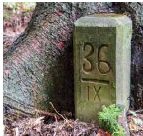
V smreko vraščen vmesni mejnik.

Na koncu doline vas gozdna pot usmeri desno v hrib, kjer prečkate nekdanjo mejo. Tik preden stopite iz gozda in se pred vami odprejo travniki, v zavetju smreke na vaši desni strani poiščite vraščen vmesni mejnik 36/IX .