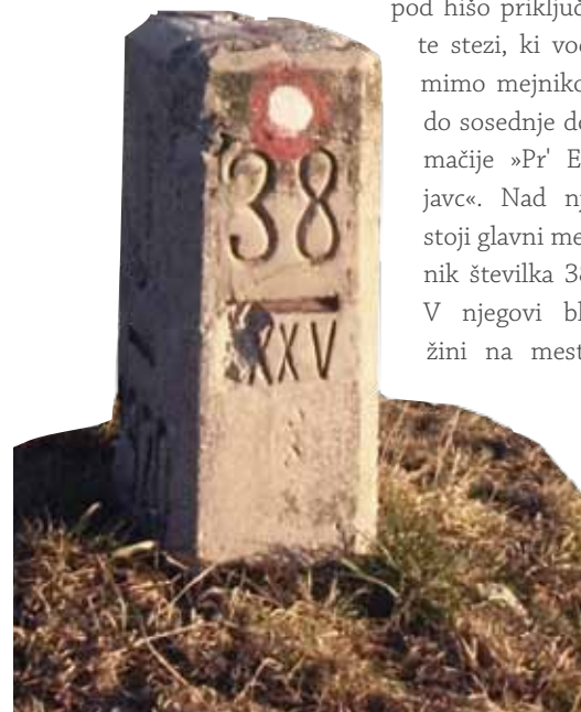
Navadni mejnik ob stezi z Mrzlega vrha proti Breznici.

nega mejnika št. 39 , ki stoji v gozdu pod vasjo Breznica . Po ogledu mejnika se vrnete nekaj metrov nazaj in nadaljujete pot proti vasi Breznica, ki je bila med obema svetovnjima vojnama del Kraljevine Italije. V središču vasi stoji cerkev sv. Kancijana. Ob vasi stojita tudi dve kaverni , ki sta bili zgrajeni za potrebe italijanskih obmejnih uslužbencev (gafovcev). Od tu lahko pot proti Mrzlemu vrhu nadaljujete po markirani planinski poti, če pa želite videti čim več mejnikov, se držite oznak za tematsko pot. Ko pod vznožjem Mrzlega vrha že zapustite gozd, se z vzponom odpirajo lepi razgledi na hribe in gore. Pot nadaljujete ob pašnikih čez »Loncmanovo« Sivko po markirani planinski poti (987 m). V neposredni bližini je pred drugo svetovno vojno stala kasarna MVSN (Milizia Volontaria per la Sicurezza Nazionale), ki je bila po vojni porušena. Z »Loncmanove« Sivke se lahko podate kar po bližnjici, mimo bližnje kmetije »Pr' Vodičari« do glavnega mejnika 38 , ali pa se spustite do spodnje domačije »Pr' Belin« (Mrzli Vrh 8), kjer se