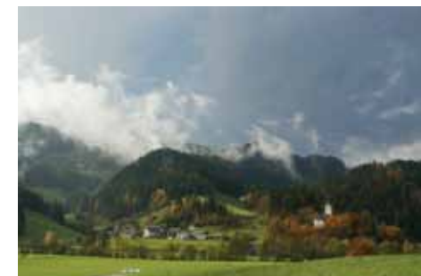
Ledin'ca s cerkvijo sv. Ane.

nekdanje jugoslovanske graničarske karavle nastaja nova planinska koča. Od tu se lahko skozi Jarčjo dolino in mimo Ledinice , kjer stoji cerkev sv. Ane, vrnete v Žiri na izhodiščno mesto, ali pa pohod nadaljujete naprej proti Sovodnju.