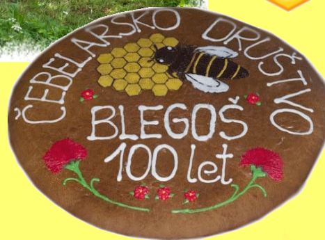
Največji medenjake, premer 1 m