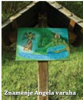
Znamenje Angela varuha

povezanih med seboj, po lesenih stebrih po bregu navzgor, navzdol pa so istočasno odvažali izkopani material. Cerkev je bila, kot večina starih zaliloških hiš, prvotno krita s skrilom .