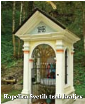
Kapelica Svetih treh kraljev

Cerkev je bila posvečena 14. 10. 1877, naslednje leto pa je bil narejen nov glavni oltar. V sredini oltarja je kip Loretske Matere Božje z Jezusom v naročju, pod njo pa angeli po morju prinašajo Marijino hišo iz Nazareta v mesto Loretto.